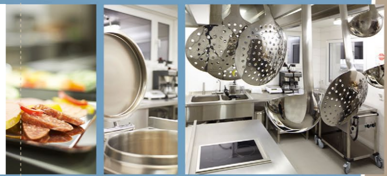
Stets frisch und lecker: Bei uns im Haus zubereitete Speisen dank hauseigener Küche

Trotz der überschaubaren Kapazität von nur 48 Bewohnern verfügt das Pflegezentrum über eine hausinterne Küche. Dies ermöglicht eine individuelle und frische Speiseversorgung aller Bewohner.