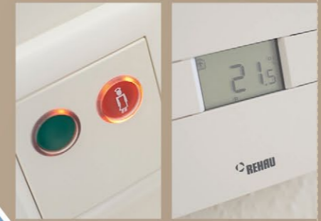
Moderne Schwesternrufanlage und digitales Thermostat in den Bewohnerzimmern